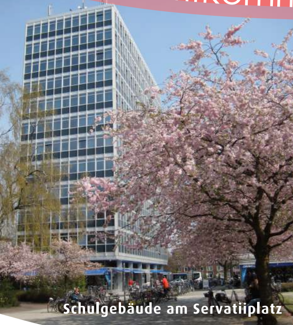
Schulgebäude am Servatiiplatz

Con más de 60.000 estudiantes, Münster es una de las ciudades universitarias más grandes de Alemania y uno de los lugares preferidos mayoritariamente por los estudiantes. La gente joven marca el ritmo de la ciudad y le da un carácter abierto y una atmósfera especial.